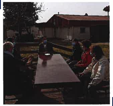
Rencontre avec les éleveurs de poules noires et palmipèdes à la maison du Magnoac, l'occasion notamment d'évoquer les problèmes de la grippe aviaire.

Je salue les services de l'État et tous les acteurs qui sont pleinement mobilisés dans la gestion de cette crise et c'est dans ce cadre, que j'ai souhaité rencontrer les producteurs de poules noires et de palmipèdes lors de ma visite dans le Magnoac.